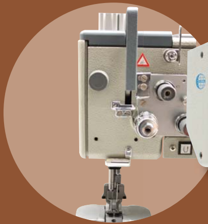
LP 1768-2 SNB AUT