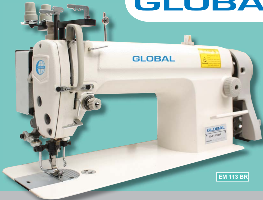
EM 113 BR