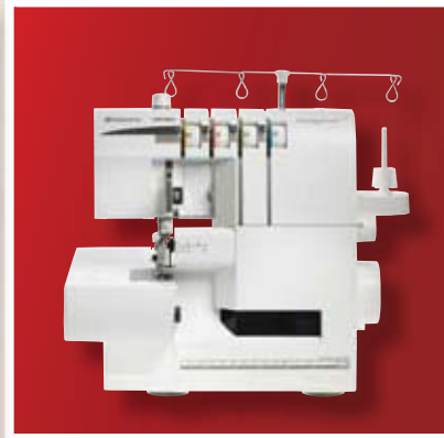
HUSKYLOCK™ s15 15 tipova šava