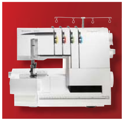
HUSKYLOCK™ s21 21 tip šava