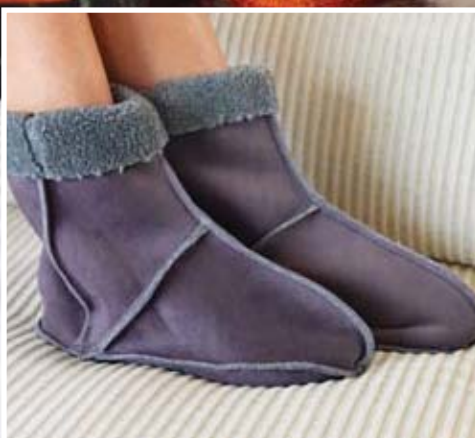
Komforne papuče sa overlok šavom.