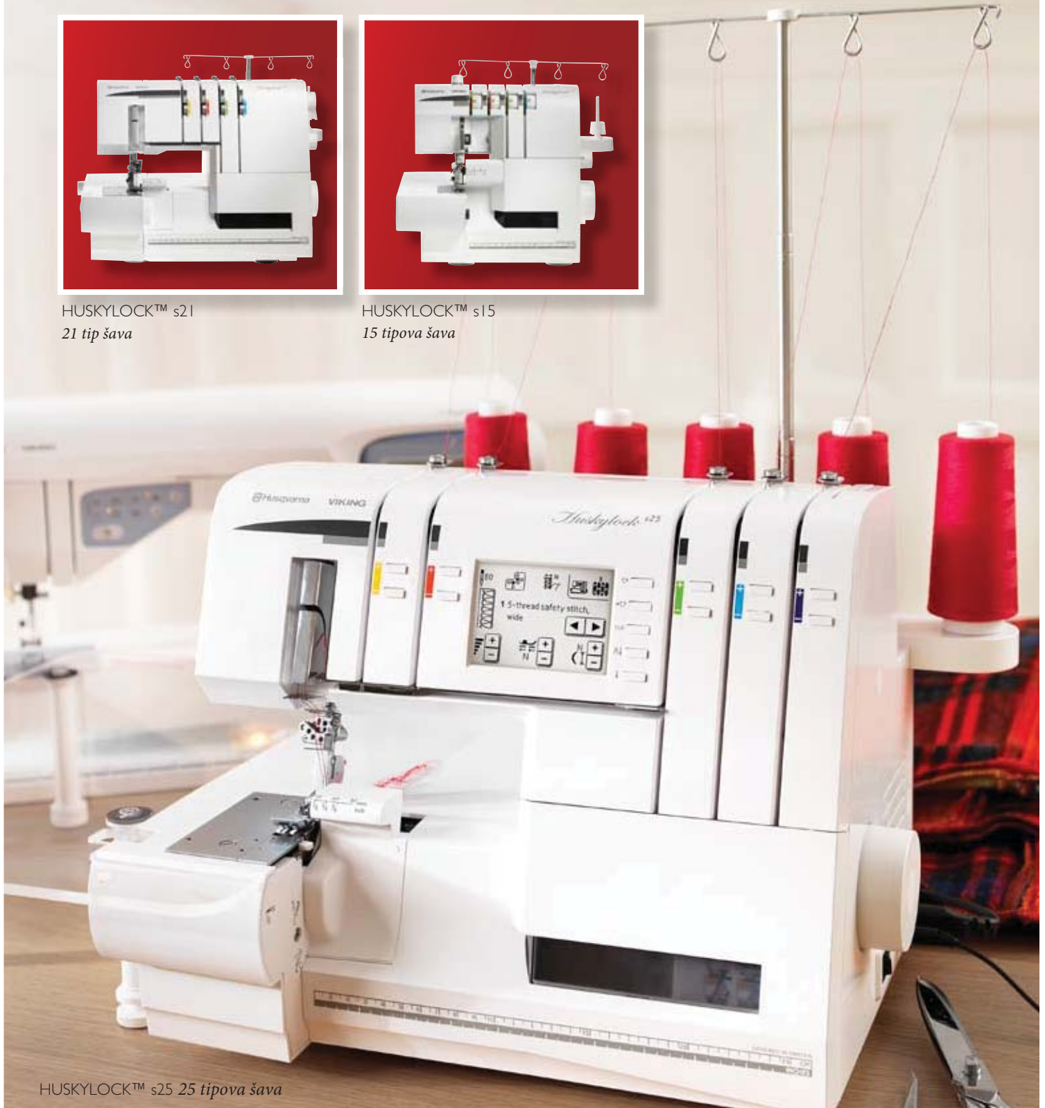
HUSKYLOCK™ s25 25 tipova šava

Zadivljujući odjevni predmeti i ukrasni predmeti za Vaš dom su sve osim uobičajeni. Kao i HUSKYLOCK overlovke, oni su inovativni od unutrašnjih šavova pa do vanjskih, ukrasnih i inspirisat će Vas na unikatne projekte koji prikazuju pogodnosti posjedovanja ove mašine. Bez obzira da li tek započinjete ili ste iskusni entuzijasta, HUSQVARNA VIKING porodica overlovki ima pravu opciju za Vas.