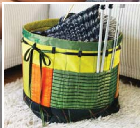
Košarica za pletenje sa džepovima za igle.