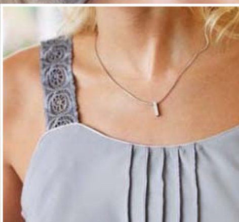
Kamisol sa overlok naborima.