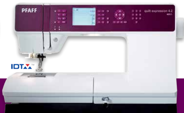
quilt expression™ 4.2