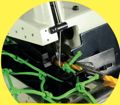
COV 2503 FN